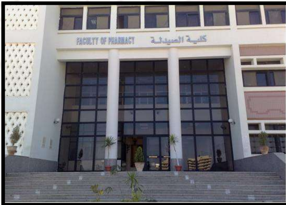
مبنى كلية الصيدلة