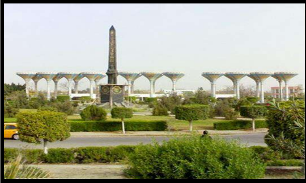
مدخل جامعة قناة السويس بالإسماعيلية