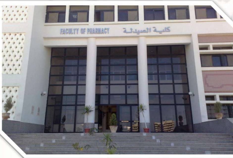
مدخل كلية صيدلة جامعة قناة السويس بالإسماعيلية