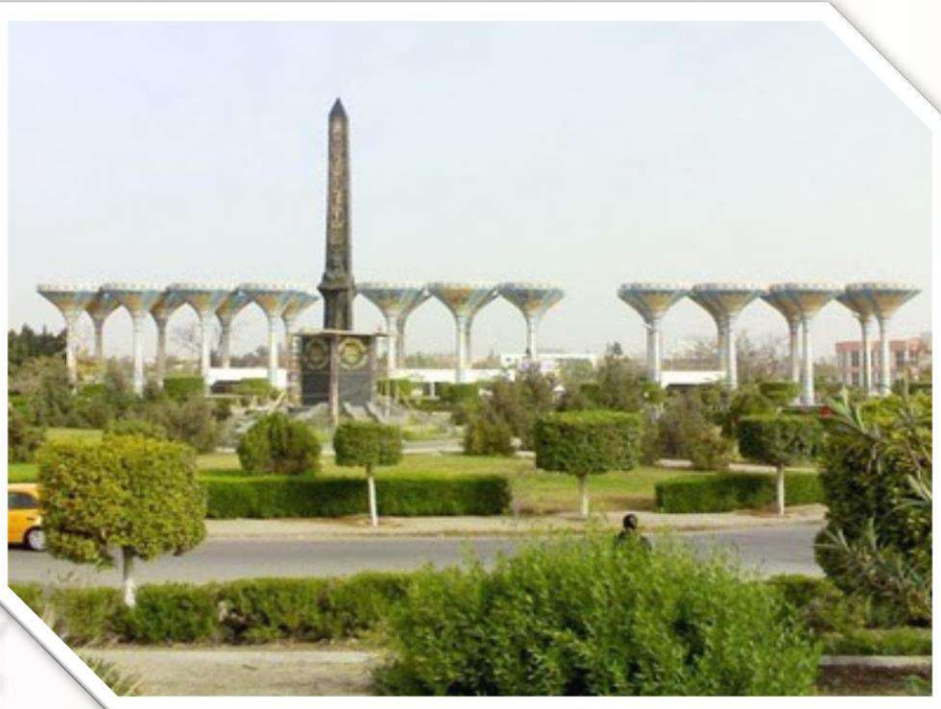
مدخل جامعة قناة السويس بالإسماعيلية