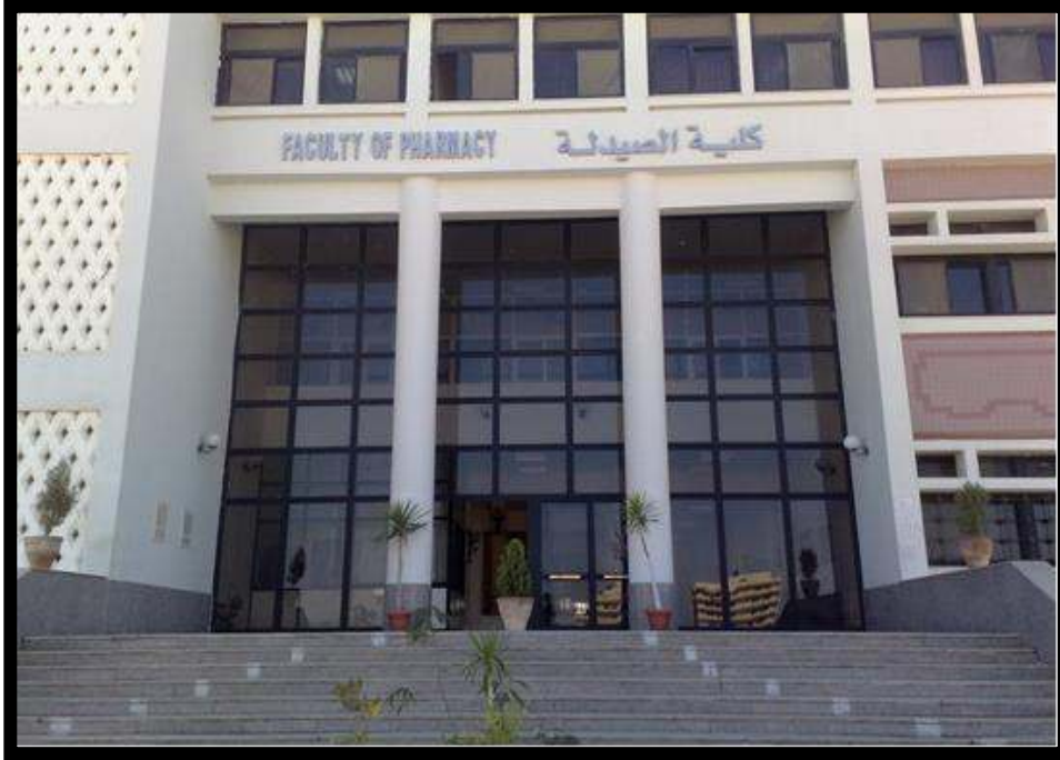
مبنى كلية الصيدلة