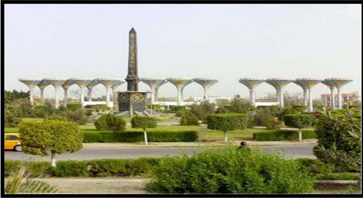
مدخل جامعة قناة السويس بالإسماعيلية